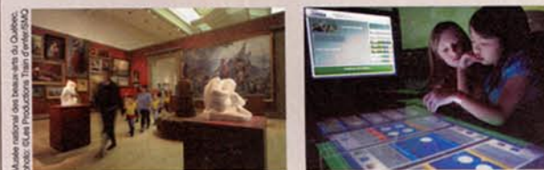
Musée national des beaux-arts du Québec, photo: © Les Productions Truitt/ArtPhoto

Partez à la découverte des musées du Québec ! La Société des musées québécois vous propose plus de 300 musées, lieux d'interprétation et centres d'exposition, autant de façons de goûter aux plaisirs du tourisme culturel et de découvrir les régions du Québec, l'histoire, les sciences et les arts! Pour tout connaître sur ce qu'il y a à faire et à voir dans ces institutions muséales, visitez le site Musées à découvrir www.musees.qc.ca . Vous y trouverez les informations utiles pour planifier votre séjour, dont un calendrier des expositions et des activités culturelles et éducatives.